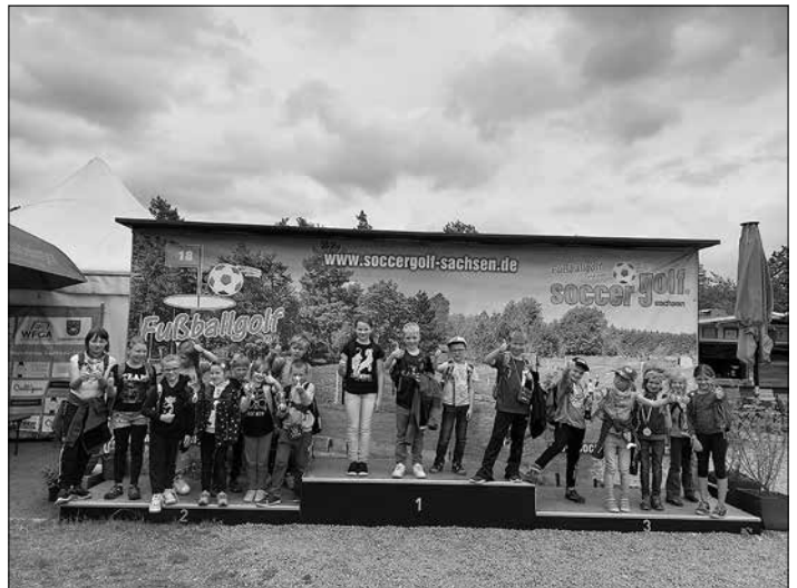
Daumen hoch fürs Soccergolf in Ottendorf-Okrilla. Das hat uns allen gefallen. („Reimt sich. Hihi“)