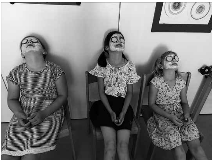
Wir hatten auch einen Beauty-Tag, denn Ferien sind zur Erholung da. „Bitte nicht ansprechen!“