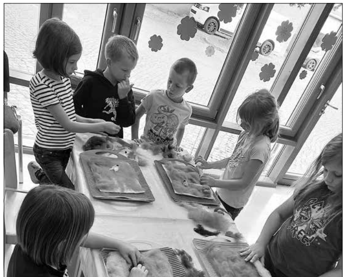
Hier haben wir gefilzt. Dafür brauchte man viel Ausdauer. Und die Hände waren danach ganz schrumpelig. (->)