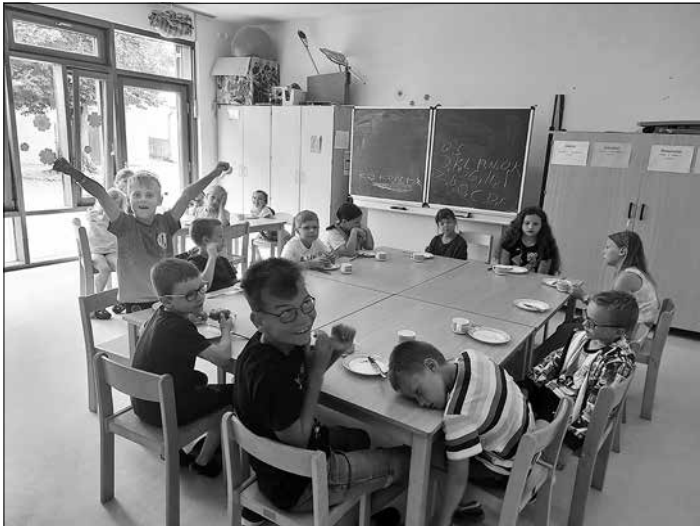
Nach der Übernachtung waren wir alle müde. „Das war doch nur Quatsch!“