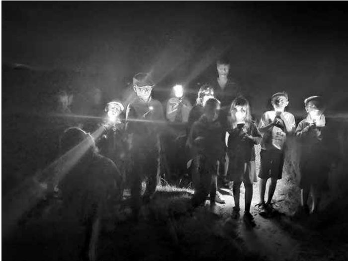
Als wir im Hort übernachtet haben, waren wir zur Geisterstunde auf Nachtwanderung.