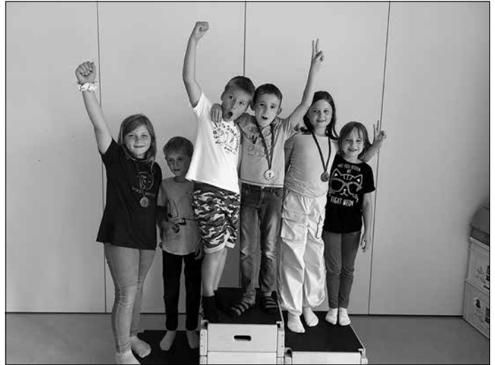
Das sind die Sieger unseres Tischkickerturniers.

In sechs Wochen Sommerferien gibt es viel zu erleben. Dies sind ein paar Eindrücke unsere Hortkinder: