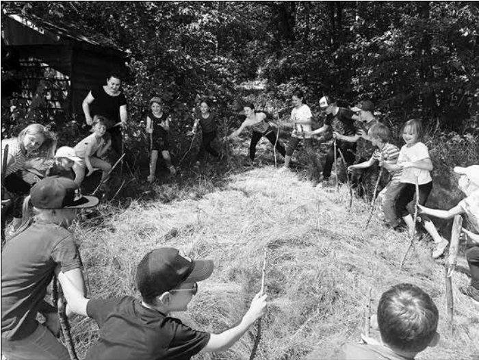
Beim Waldtag gab es lustige Spiele, die wir noch nicht kannten.