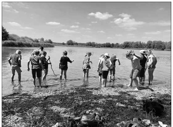
Nach der Wanderung gab es eine verdiente Abkühlung im Rohrbacher Teich

Anzeigen im Amtsblatt Haselbachtal: anzeiger@muk-werbung.de