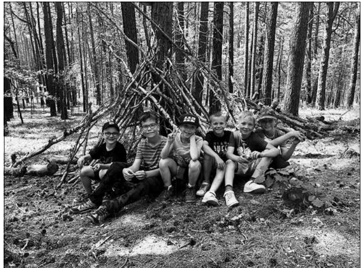
Auf der Wanderung haben wir auf dem Ochsenberg eine tolle Bude gebaut.