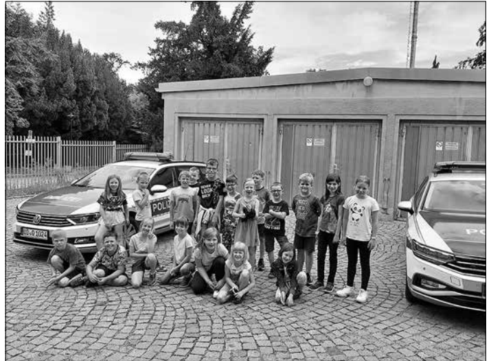
Interessant war es auf der Polizeiwache Kamenz. Dort gibt es sogar Gefängniszellen.